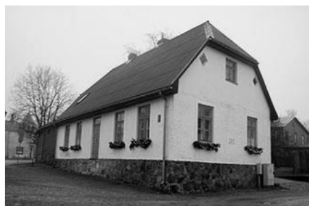
Gatavojoties svētkiem izrotāts tapa draudzes nams un baznīcas egle, gatavotas tapa apsveikuma kartiņas, ceptas piparkūkas

Lai Kungs mums palīdz sekot Viņam un kļūt par patiesiem mācekļiem! Lai apustulis Jānis būtu piemērs no kā mācīties mīlestības mācību, zināt laiku klusumam. Lai mēs justos Kristus mīlēti un lai mēs spētu pavadīt savu dzīvi, liecinot par Viņu.